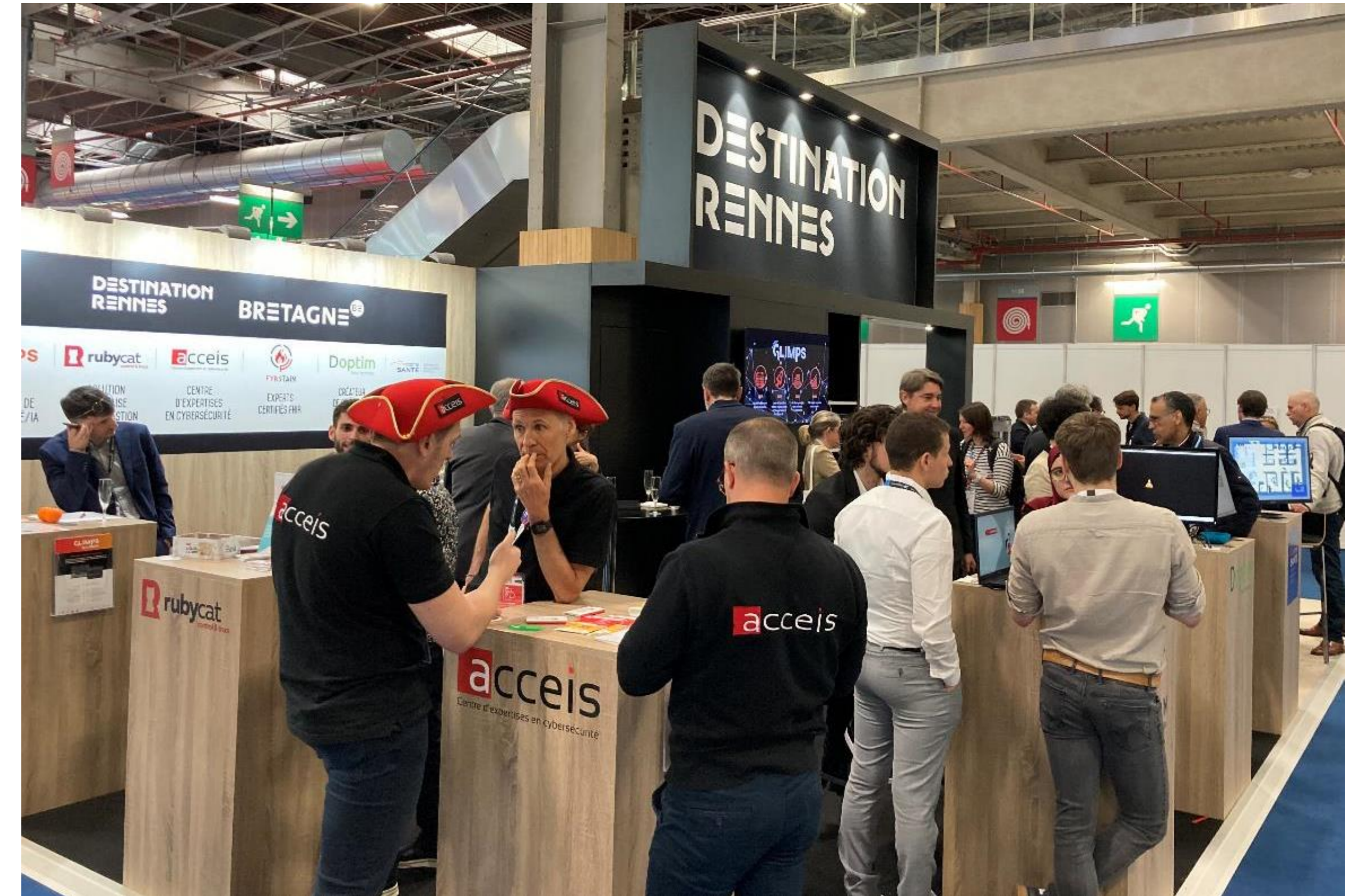
Stand Destination Rennes - Bretagne 2023