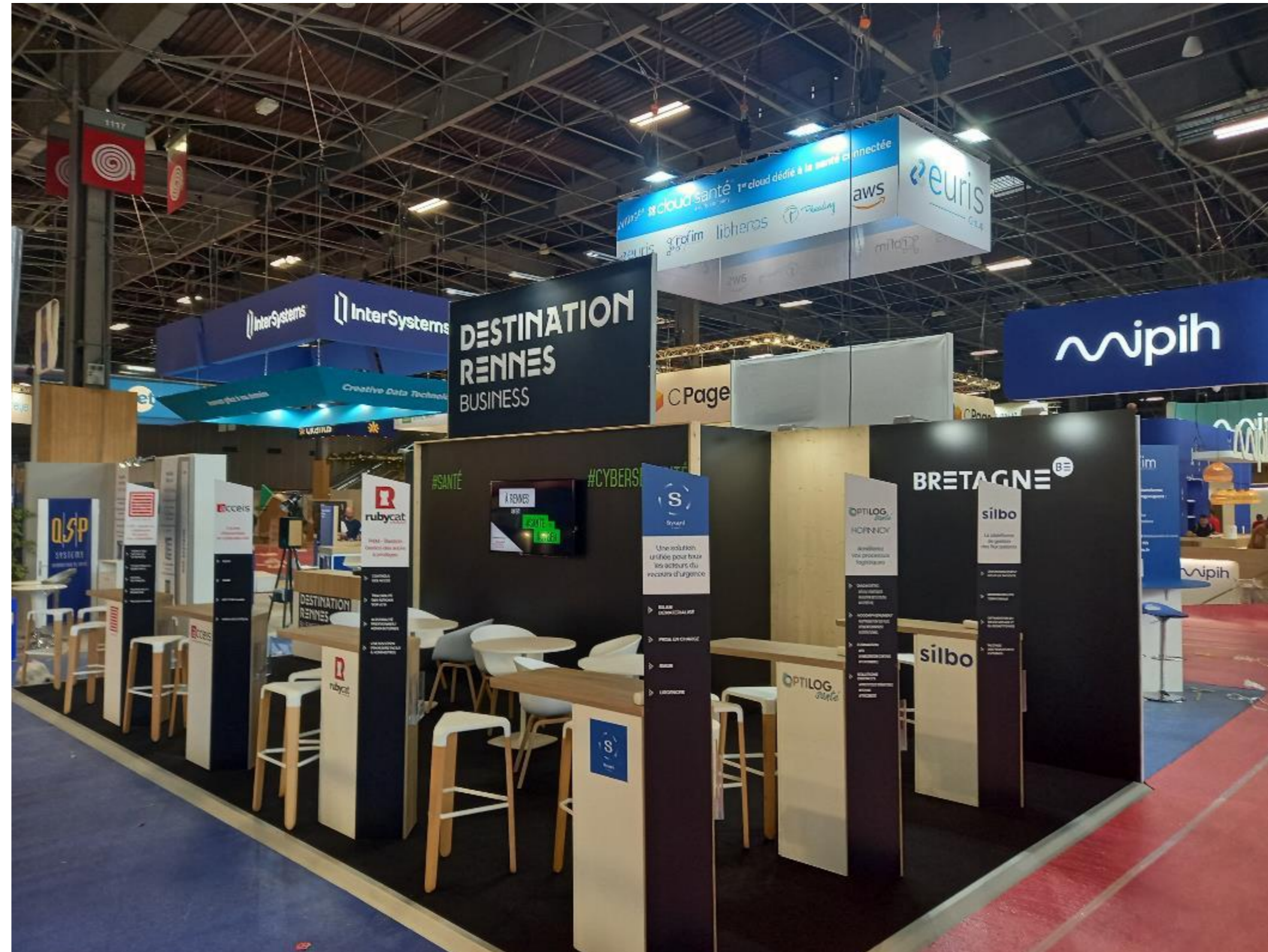
Stand Destination Rennes – Bretagne 2022