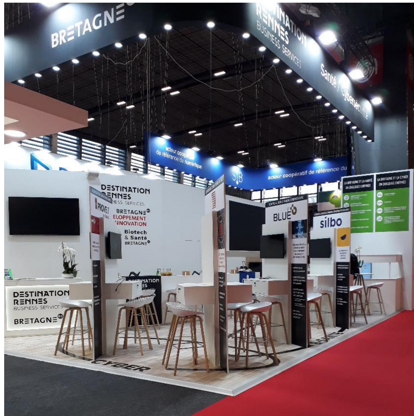
Stand Destination Rennes Bretagne / SIB 2021