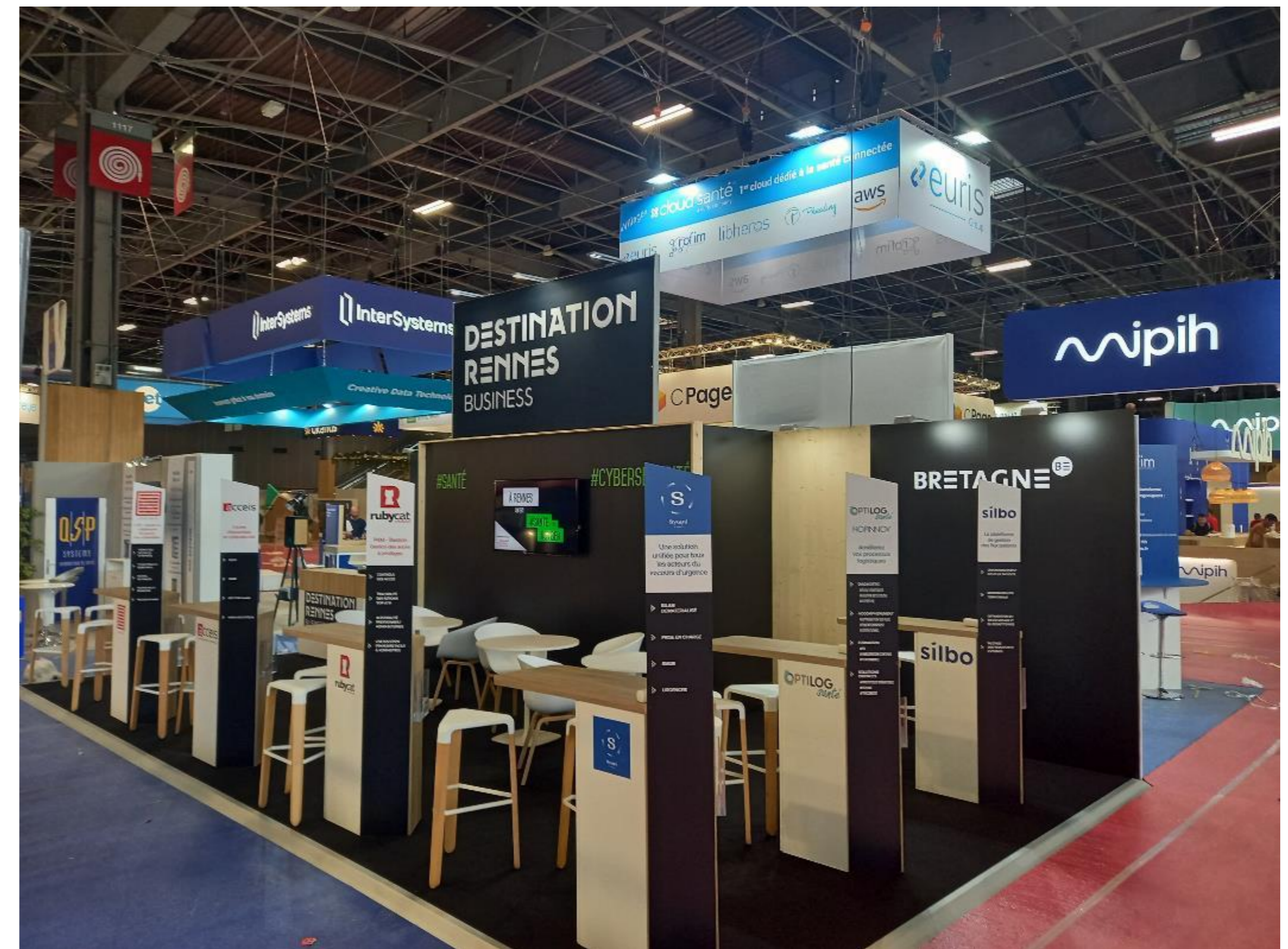
Stand Destination Rennes – Bretagne 2022